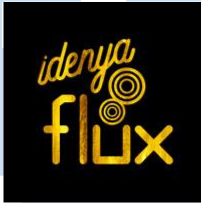
Gambar 2.2 Logo Idenya Flux

Idenya Flux juga memiliki misi untuk memberikan kontribusi terbaik terhadap perkembangan industri periklanan Indonesia. Idenya Flux juga akan memberikan ide-ide “emas”nya untuk mengubah tujuan dari setiap kliennya menjadi sebuah emas yang mana sesuai dengan slogan Idenya Flux “ Golden Ideas ”.