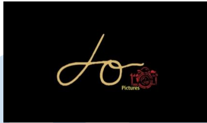
Gambar 2. 1. Logo Dospictures

Creative agency Dospictures memiliki logo yang tertera pada gambar 2.1 diatas. Logo tersebut memiliki huruf D dan O yang ditulis secara sambung. Menurut Hendrawan sendiri mengatakan bahwa huruf D dan O jika dibaca menggunakan bahasa inggris maka menjadi “do” yang berarti melakukan. Pada penulisan D dan O juga ditulis secara sambung emngartikan pekerjaan yang tidak terputus dan long lasting . Logo kamera dan tulisan “pictures” sendiri mengartikan Dospictures bergerak pada bidang kreatif dan berfokus pada audio dan visual .