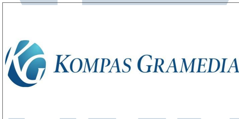
Gambar 2.1. Logo PT Kompas Gramedia