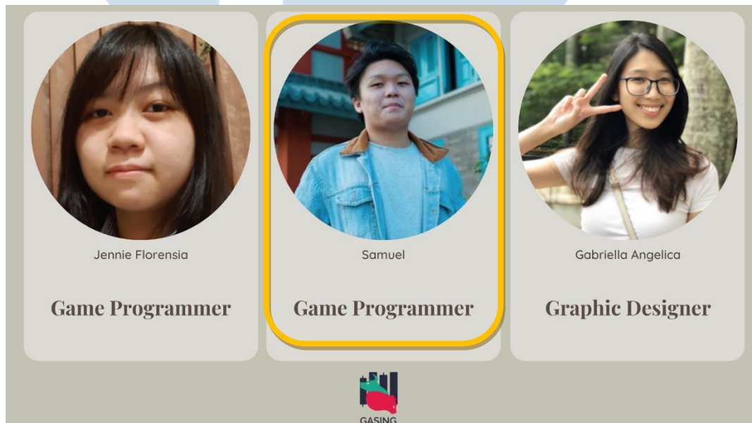
Gambar 2.4 GASING Team (2)

U N I V E R S I T A S M U L T I M E D I A N U S A N T A R A