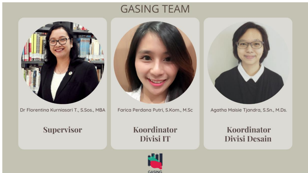
Gambar 2.3 GASING Team (1)