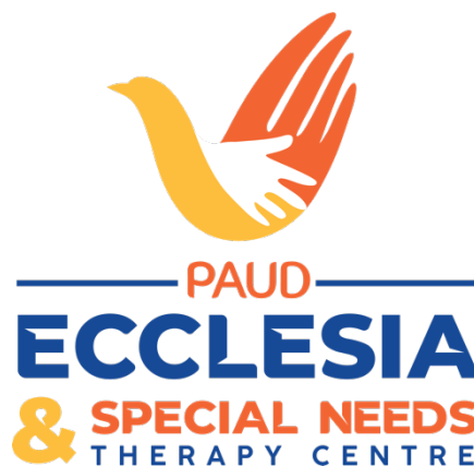
Gambar 2.2 Logo PAUD GBI Ecclesia