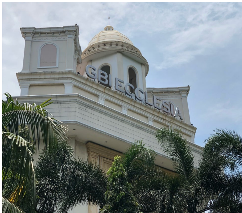
Gambar 2.4 Tampak luar gedung utama GBI Ecclesia

Gereja ini mulai beroperasi pada tanggal 21 April 1996 di dalam komplek perumahan Taman Semanan Indah. Pada awalnya, gereja ini hanya dibuat di sebuah ruko, namun pada tahun 2003 gereja ini mulai dibangun menjadi satu gedung besar (Ecclesia, 2017). Pemimpin atau Gembala Sidang dari gereja ini adalah Pdt.