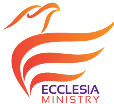
Gambar 2.1 Logo GBI Ecclesia

Yayasan GBI Ecclesia Internasional adalah sebuah organisasi ataupun tempat yang dikhususkan untuk kegiatan keagamaan. Dengan kata lain, dapat disebut sebagai sebuah gereja Bethel. Meskipun bergerak di bidang keagamaan, gereja ini juga memiliki sekolah untuk pendidikan usia dini atau PAUD untuk anak-anak yang berkebutuhan khusus, maupun normal. (Ecclesia, 2017)