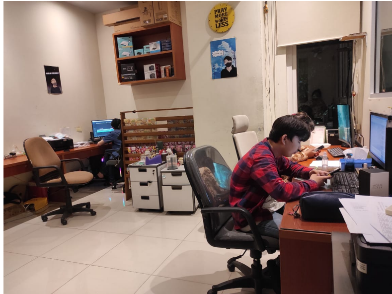
Gambar 2.3 Ruang kantor Divisi Multimedia