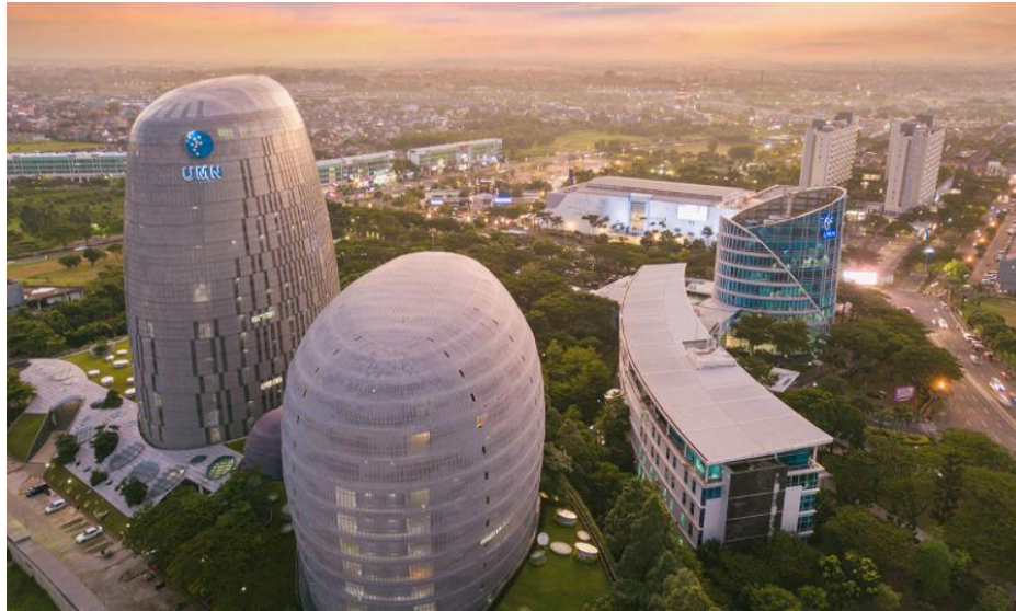
Gambar 2.1 Kampus UMN