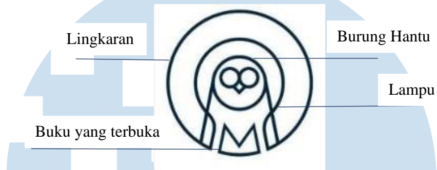
Gambar 2.1. Logo Studio Mune