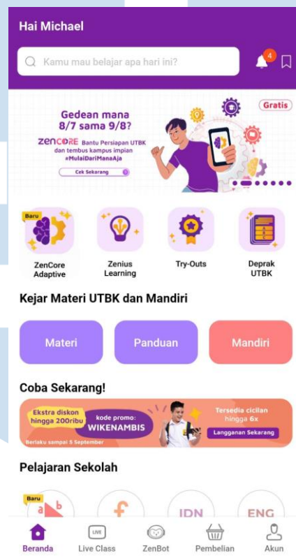
Gambar 0.2. Tampilan Zenius app

Enam tahun berlalu, pada tahun 2017 website zenius.net dikunjungi sebanyak 2.000.000 kali dalam sebulan, dan membuat Zenius menjadi perusahaan edutech pertama yang masuk ke Top 10 Startup di Indonesia versi startupranking.com .