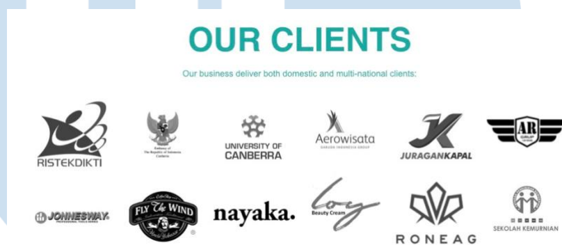
Gambar 2.2 Klien Bekantan Creative