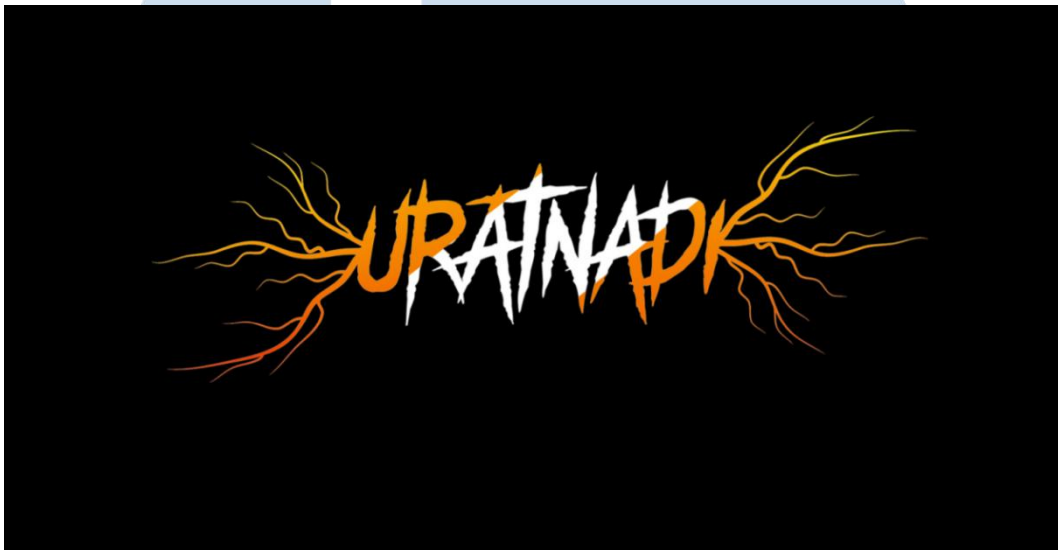
Gambar 2.1 Logo Uratnadi Visualworks