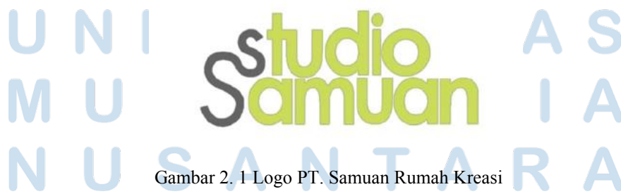
Gambar 2. 1 Logo PT. Samuan Rumah Kreasi

PT Samuan Rumah Kreasi memiliki misi Menjadi Perusahaan Terkemuka dalam mencerdaskan umat manusia melalui media komunikasi audiovisual. Berikut Gambar 2.1 adalah logo dari PT Samuan Rumah Kreasi.