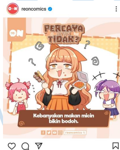
Gambar 3.4 Hasil akhir dari Ilustrasi untuk Konten Percaya atau Tidak?