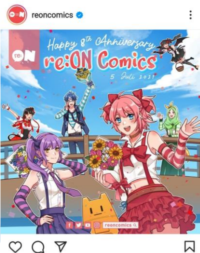
Gambar 3.2 Hasil Akhir dari Ilustrasi 8th Anniversary re:ON Comics