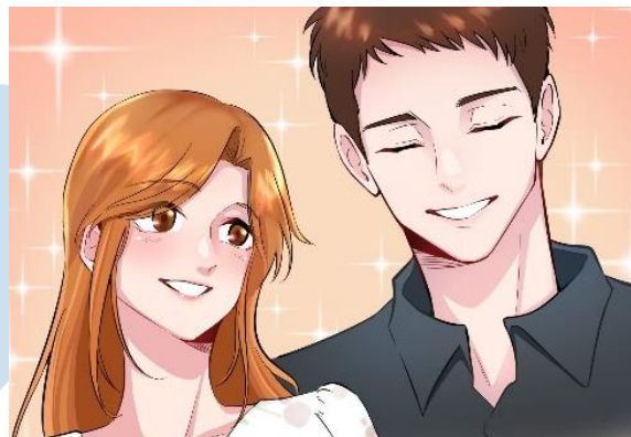
Gambar 3.8 Hasil Akhir Pewarnaan Webtoon