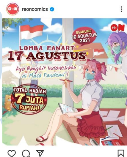
Gambar 3.6 Hasil Akhir dari Ilustrasi untuk Pengumuman lomba 17 Agustus