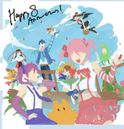
Gambar 3.1 Sketsa dari Ilustrasi 8th Anniversary re:ON Comics (sumber dokumentasi pribadi, 2021)

ilustrasi tetap menampilkan kesan perayaan. Sebelum membuat ilustrasi, penulis menentukan beberapa maskot yang akan digambar berdasarkan siapa yang sering terlihat di social media re:ON Comics yaitu, Reon, Oren, Reyna, Rion, Reno, Noer, dan Noir. Waktu yang diberikan untuk menyelesaikan ilustrasi ini adalah satu minggu. Ilustrasi yang sudah selesai dikumpulkan dalam bentuk file PSD , dengan layer karakter dan background terpisah.