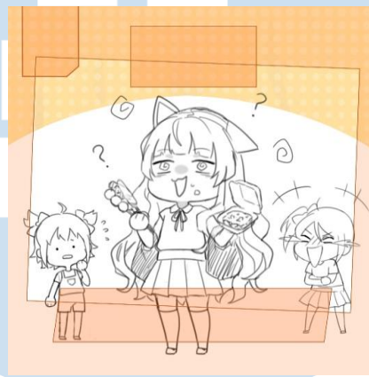
Gambar 3.3 Sketsa dari Ilustrasi untuk Konten Percaya atau Tidak?

Social media re:ON Comics mempunyai beragam konten untuk menghibur pembaca, salah satunya adalah ‘Percaya atau Tidak?’ sebuah konten yang mempertanyakan mitos yang umum beredar di masyarakat. Tema yang diberikan oleh supervisor adalah kebanyakan micin bikin bodoh, dengan brief karakter Oren sedang ngemil jajan dengan wajah bodoh, Reyna tertawa melihat Oren, dan Reon dengan wajah khawatir.