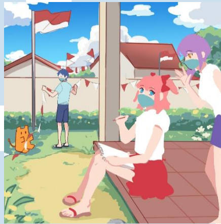
Gambar 3.5 Sketsa dari Ilustrasi untuk Pengumuman lomba 17 Agustus

Selain menyajikan konten meghibur, re:ON Comics juga sering mengadakan lomba menggambar dengan tema yang berbeda setiap periodenya. Supervisor memberikan brief dimana karakter Reon sedang menggambar di halaman rumah, karena ini adalah lomba untuk memperingati hari kemerdekaan, maka ilustrasi ini wajib menampilkan tiang bendera.