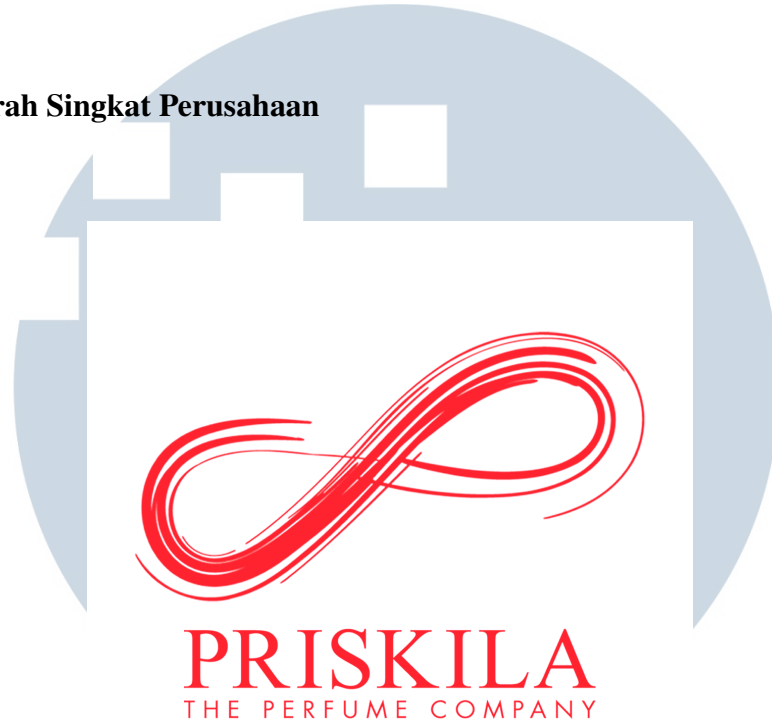
Gambar 2.1. Logo Perusahaan PT. Priskila Prima Makmur