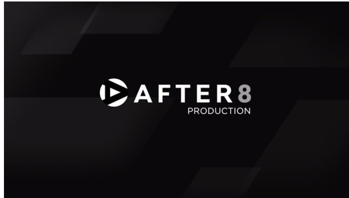
Gambar 2.1 Logo Perusahaan