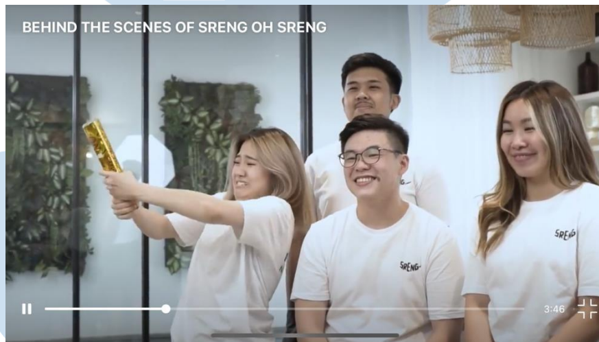
Gambar 3.3 Laporan Hasil Kerja dalam Behind The Scene Sreng