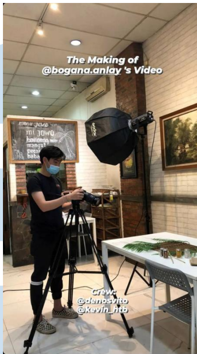
Gambar 3.5. Laporan Hasil kerja dalam Proyek Nasi Bogana Ny. An Lay