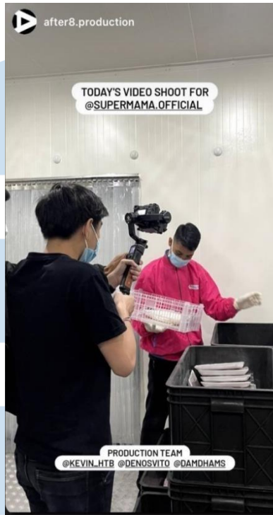
Gambar 3.8. Laporan Hasil Kerja Magang dalam Projek Supermama