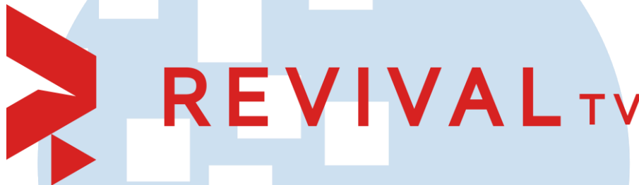
Gambar 2.1. Logo RevivalTV