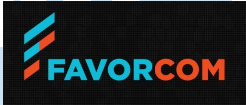
Gambar 2.1 Logo Agensi Favorcom