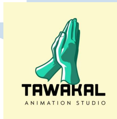
Gambar 2.1. Logo Tawakal Animation Studio

Tawakal Animation Studio adalah studio spesialis animasi 2-Dimensi yang terletak di Perumahan Permata Buah Batu Ruko R4, Lengkong, Bandung. Didirikan pada 2019 awal, nama studio membawa arti dari singkatan “Tawa” dan “Akal” yang mewakilkan hiburan dan edukasi dalam acara animasi. Jasa yang disediakan Tawakal Animation Studio berfokus pada pembuatan video dan animasi, branding , dan concepting event untuk klien lokal serta internasional dari Amerika Serikat, India, Belanda, Qatar, Inggris, Kanada, Swedia, Jerman, dan Australia.