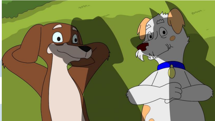
Gambar 2.2 Animasi Series Very Important Pup (sumber YouTube, 2021)

Salah satu hasil jasa yang disediakan oleh Tawakal Animation Studio dalam pembuatan karya berkualitas dan sesuai dengan kebutuhan klien berupa animasi series Very Important Pup (2020) yang diciptakan oleh Jared Johnson. Dengan tim 2D Animator yang tersedia, Tawakal Animation Studio mampu menerima proyek outsource dari klien internasional.