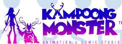
Gambar 2.1. Logo Kampoong Monster (dokumentasi perusahaan)