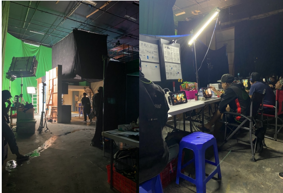
Gambar 3.3. Laporan Hasil Kerja Dalam Traveloka Manifesto

pihak agensi dan klien menggunakan terminologi “menjual frame ”, dan proses penjualan frame tersebut dilakukan melalui Zoom meeting .