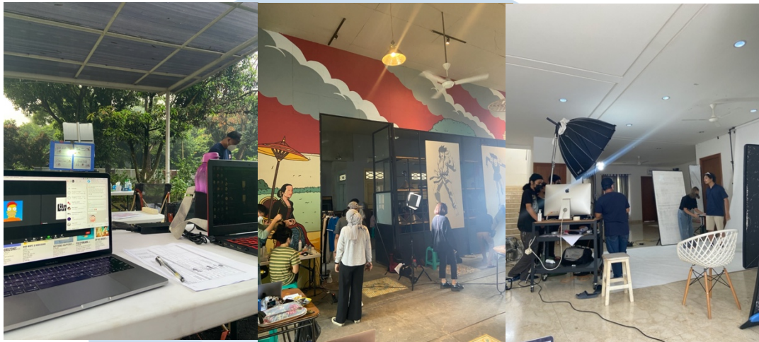
Gambar 3.2. Laporan Hasil Kerja Dalam Traveloka Invictus