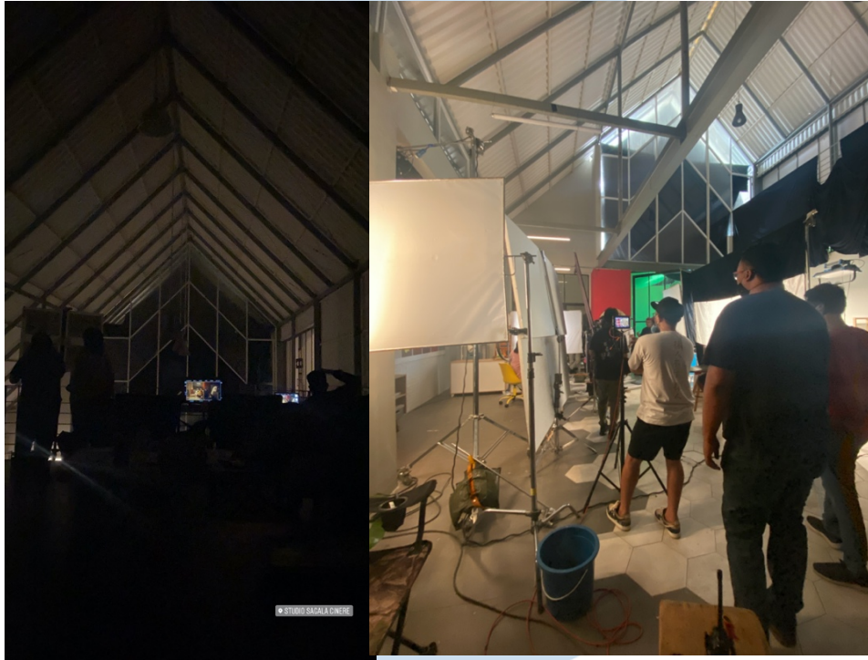
Gambar 3.4. Laporan Hasil Kerja Dalam Chocolatos Drink RTS