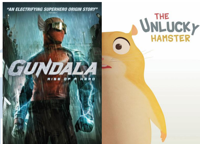
Gambar 2.2. Film Gundala dan animasi pendek The Unlucky Hamster