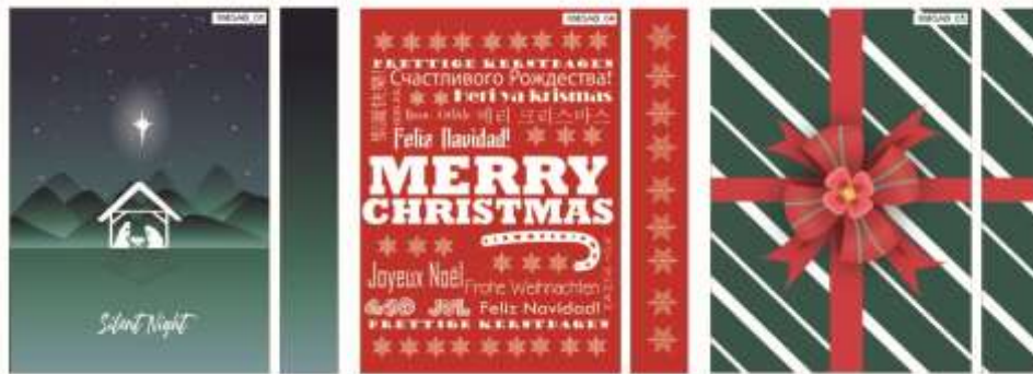
Gambar 3.2. Tema Natal

Pada tanggal 14 Juni 2021, penulis baru pertama kali bekerja secara work from office di PT CMAI. Di sana, penulis melakukan briefing terlebih dahulu mengenai PT CMAI dan produk apa sajakah yang diproduksi. Penulis dengan beberapa anak magang lainnya sempat berkeliling dan melihat showcase produk produk yang diproduksi oleh PT CMAI. Di sana juga, penulis sudah diberikan tugas untuk membuat design giftbox dengan batas 10 design perhari. Tetapi setelah satu minggu dan berganti supervisor , batas minimal design perhari yang kita kerjakan berkurang menjadi minimal 3 buah design perharinya asalkan design yang sudah selesai tidak setengah jadi. Dari tanggal 14 Juni hingga tanggal 30 Juni 2021, penulis membuat sebanyak 58 design dengan tema christmas berupa design vector .