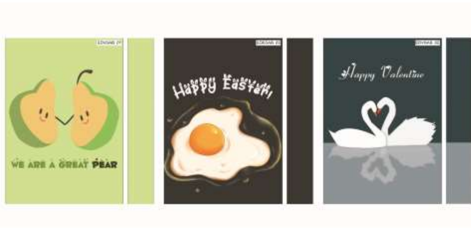
Gambar 3.3. design produk universal

8 Juli hingga 12 Juli, supervisor memberikan tema dan produk baru sebagai media, yakni notepaper yang dapat membentuk benda-benda yang berbasis melingkar. Dalam satu hari pengerjaan, tema setiap note paper yang dibuat harus sama. Misalnya, tema hari ini adalah buah, maka penulis membuat beberapa design dengan tema buah yang diaplikasikan ke dalam note paper . Selama 5 hari, sebanyak 13 design note paper dengan beragam tema telah dibuat. Design yang dibuat berupa gambar bitmap .