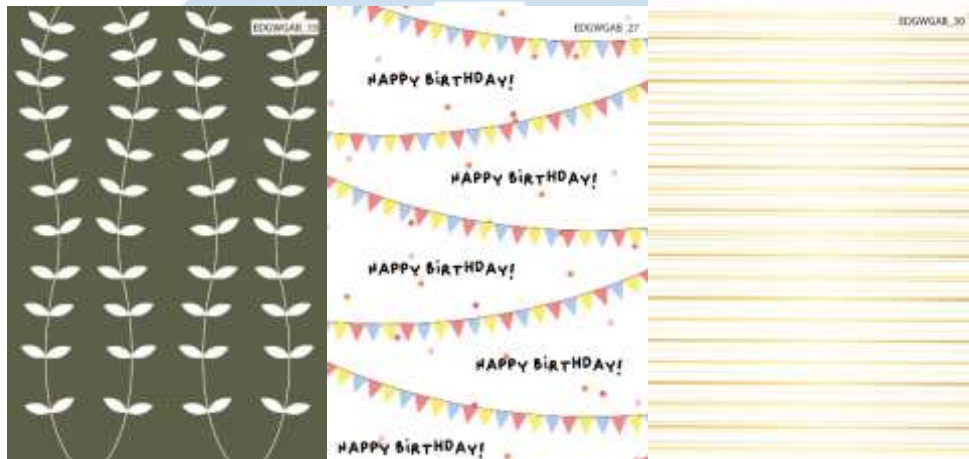
Gambar 3.5. giftwrap luxury and birthday

dibuat. Tema pertama adalah colorful birthday sebanyak 3 buah design yang selesai sebelum jam makan siang (12:00). Tema kedua adalah giftwrap dengan warna silver atau gold sebanyak 4 buah.