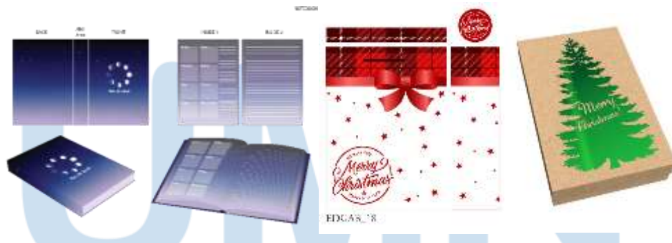
Gambar 3.8. notebook, giftbag, dan mock up 3D kraftbox

20 Agustus sampai 25 Agustus, membuat design untuk notebook. Design yang dibuat harus menunjukkan cover, back cover, isi, dan tampilan notebook dari \frac{3}{4} sisi. 26 Agustus sampai 8 September, membuat design yang akan ditujukan pada client dengan 5 tema, yakni wedding, baby, birthday, christmas, dan Hanukkah . 9 September hingga 15 September, penulis mendapatkan tugas yang benar-benar baru. Yakni membuat mockup secara 3D untuk giftbox dengan bahan kraft dan texture foil pada designnya . Penulis menggunakan Autodesk MAYA untuk mengerjakan modelling dan animasi, dan dengan bantuan Adobe Photoshop CS6 untuk texture pada 3D kraftbox .