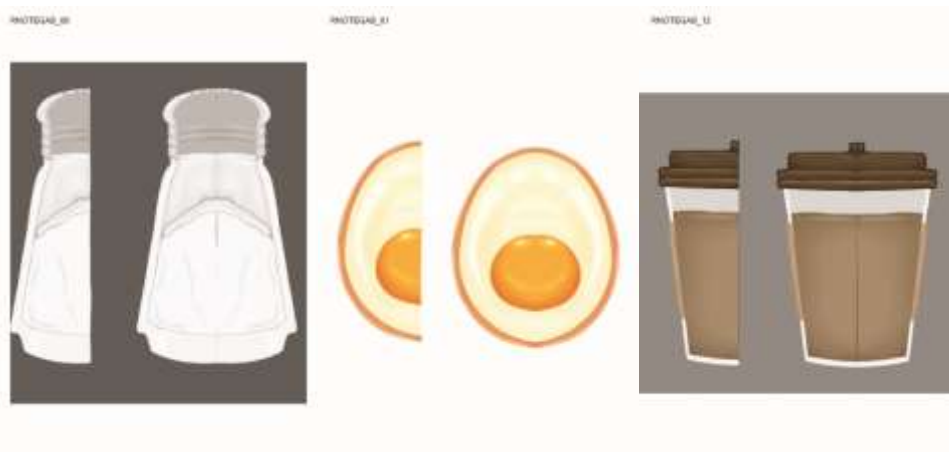
Gambar 3.4. Note paper

8 Juli hingga 12 Juli, supervisor memberikan tema dan produk baru sebagai media, yakni notepaper yang dapat membentuk benda-benda yang berbasis melingkar. Dalam satu hari pengerjaan, tema setiap note paper yang dibuat harus sama. Misalnya, tema hari ini adalah buah, maka penulis membuat beberapa design dengan tema buah yang diaplikasikan ke dalam note paper . Selama 5 hari, sebanyak 13 design note paper dengan beragam tema telah dibuat. Design yang dibuat berupa gambar bitmap .