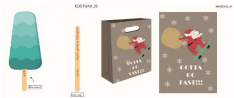
Gambar 3.7. gift tag dan mockup 2D giftbag

20 Agustus sampai 25 Agustus, membuat design untuk notebook. Design yang dibuat harus menunjukkan cover, back cover, isi, dan tampilan notebook dari \frac{3}{4} sisi. 26 Agustus sampai 8 September, membuat design yang akan ditujukan pada client dengan 5 tema, yakni wedding, baby, birthday, christmas, dan Hanukkah . 9 September hingga 15 September, penulis mendapatkan tugas yang benar-benar baru. Yakni membuat mockup secara 3D untuk giftbox dengan bahan kraft dan texture foil pada designnya . Penulis menggunakan Autodesk MAYA untuk mengerjakan modelling dan animasi, dan dengan bantuan Adobe Photoshop CS6 untuk texture pada 3D kraftbox .