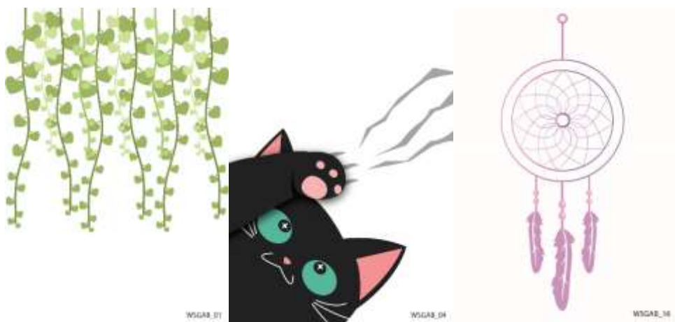
Gambar 3.6. Wallsticker

Produk berikutnya yang ditugaskan pada penulis adalah wall sticker . Selama 8 hari, penulis menghasilkan sebanyak 19 design dengan beragam bentuk. Setelah beberapa minggu bekerja dengan tema yang berbeda-beda, pada tanggal 27 Juli hingga 5 Agustus, penulis kembali bekerja untuk produk secara universal dengan empat tema, yakni christmas , valentine , easter , dan halloween .