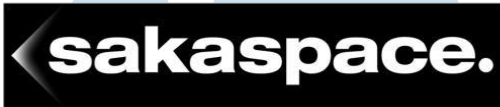
Gambar 2.1. Logo Sakaspace