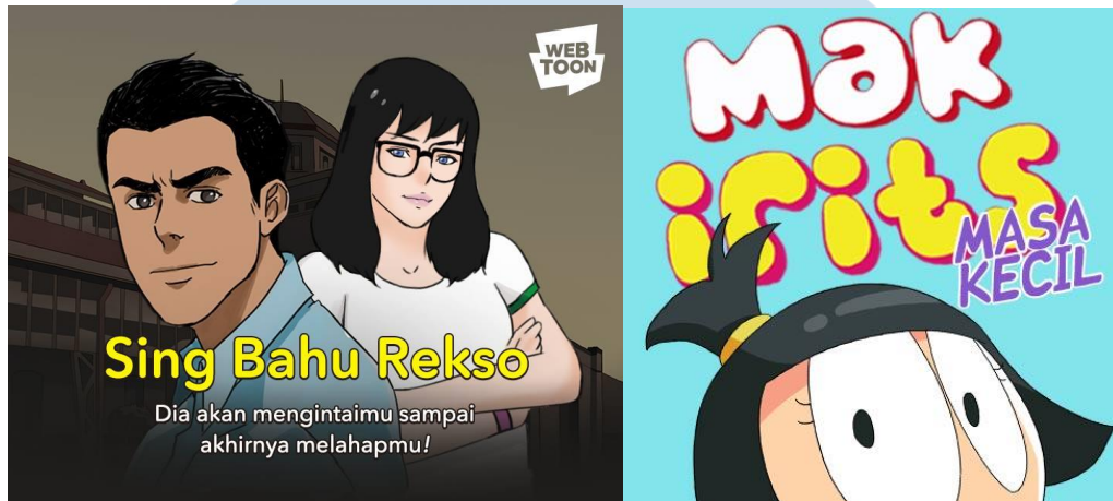
Gambar 2.2. Komik Sing Bahu Rekso dan Mak Irits

berasal dari Amerika Serikat, salah satunya adalah Voltron Force dari Viz Media, Amerika Serikat.