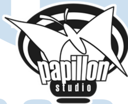
Gambar 2.1. Logo Papillon Studio (Dokumen Perusahaan)