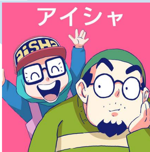
Gambar 2.3. Komik Aisha Tomodachi

Papillon Studio memiliki visi dan misi yang sudah diterapkan selama kurang lebih sepuluh tahun, yaitu;