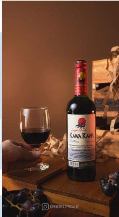
Gambar 3.13 Look and mood video produk kawa kawa

Pada proyek kali ini, Kawa Kawa mengajukan untuk membuat sebuah video cinematic portrait produk yang nantinya akan disebarakan melalui Instagram. Client memberikan permintaan yakni menunjukkan bahwa produk kawa kawa ini menggunakan anggur asli yang dipadukan dengan style yang terlihat klasik dan elegan. Kami menggunakan properti-properti yang menggunakan bahan dasar kayu bertujuan untuk memperlihatkan style yang klasik serta bahan dasar kayu yang agak kasar identik dengan tong anggur atau wine. Client juga meminta agar produknya terlihat elegan sehingga kami membuat mood warna coklat ke emas muda. Dimana pada gambar di atas merupakan look dan mood hasil dari final video tersebut.