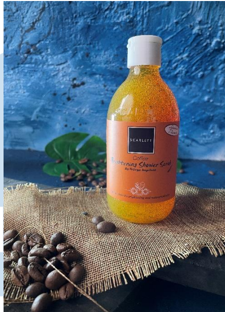
Gambar 3.8 BTS Foto Produk