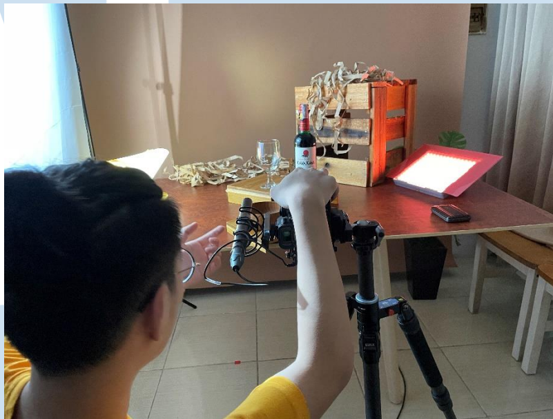
Gambar 3.12 Set-up lighting dan produk kawa kawa

U N I V E R S I T A S M U L T I M E D I A N U S A N T A R A