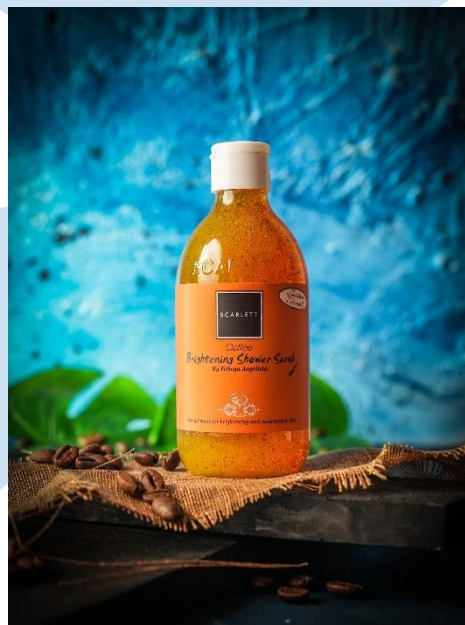
Gambar 3.9 Hasil Foto Produk

Pada proyek kali ini, Scarlett Whitening mengajukan untuk melakukan endorse pada produk barunya yakni varian kopi serta foto produk. Dimana pada