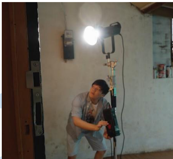
Gambar 3.7 Set-Up Lighting

Setelah keseluruhan kebutuhan untuk syuting sudah selesai di pra produksi, maka selanjutnya masuk pada tahap produksi atau syuting. Pada saat syuting penulis membantu dalam mengingatkan waktu serta membantu divisi lighting untuk memasang dan menyalakan lighting .