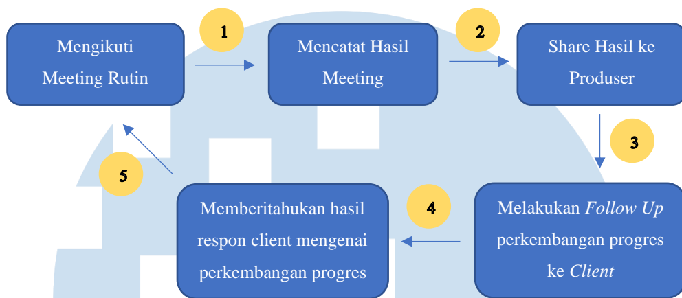
Gambar 3.2 Struktur Kerja di Luar Syuting

Struktur kerja yang dilakukan penulis sebelum atau sesudah syuting dilakukan adalah penulis pastinya akan tetap mengikuti meeting online maupun offline. Pada meeting penulis akan membantu mencatat hasil dari meeting yang kemudian diberikan kepada produser. Kemudian penulis juga membantu produser dalam membalas kontak dari client untuk mengabarkan update progress hasil konsep (sebelum syuting) dan update progress hasil syuting (setelah syuting). Setelah mendapatkan jawaban dari client, penulis akan segera memberitahukannya ke produser secara langsung.