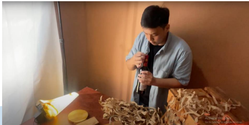
Gambar 3.11 Mempersiapkan properti kawa kawa