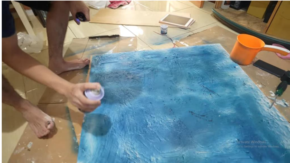
Gambar 3.6 Background Foto Produk

Setelah keseluruhan kebutuhan untuk syuting sudah selesai di pra produksi, maka selanjutnya masuk pada tahap produksi atau syuting. Pada saat syuting penulis membantu dalam mengingatkan waktu serta membantu divisi lighting untuk memasang dan menyalakan lighting .