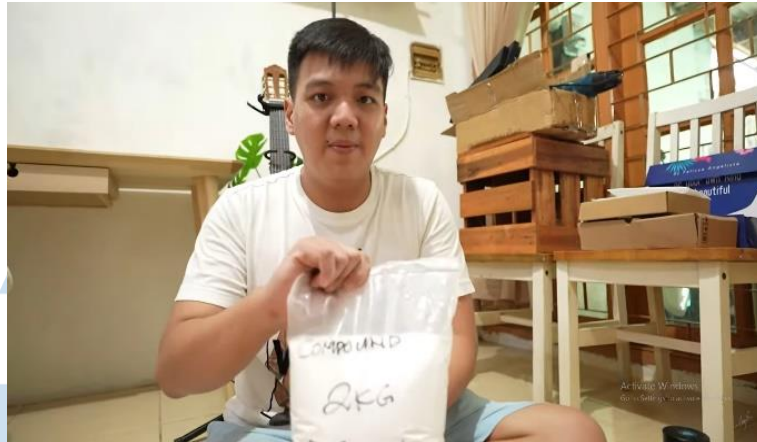
Gambar 3.4 Pembuatan Compound