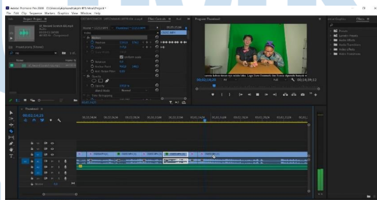
Gambar 3.3. Rough Cut Editing (Sumber: Dokumentasi Perusahaan)

Dalam tahap Rough Cut Editing , penulis melakukan pemotongan dasar hasil rekaman mentahan. Tahap ini hanya memerlukan waktu sebentar sekitar 30 menit karena penulis telah mencatat menit yang akan dipotong ketika melakukan footage preview sebelumnya. Setelah tahap ini, durasi mentahan dari 40 menit umumnya akan menjadi potongan 25 menit dan memasuki tahap selanjutnya.