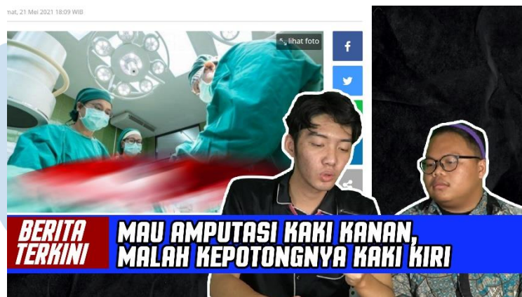
Gambar 3.6. Thumbnail Berita Terkini Episode.2

Dalam Konten “Berita Terkini”, Penulis juga menciptakan animasi teks dan gambar yang diperlukan. Motion graphic adalah tantangan yang dialami penulis karena itu merupakan hal yang jarang dilakukan dalam proses editing . Namun, hal tersebut mendorong motivasi penulis untuk mempelajari hal yang baru. Penulis menonton tutorial dan banyak mempelajari referensi yang ada di beberapa contoh variety show korea selatan sebagai referensi editing utama. Selama proses praktik kerja magang, motion graphic telah menjadi salah satu skill yang dikuasai oleh penulis dan menjadi sebuah ilmu yang sangat bermanfaat.