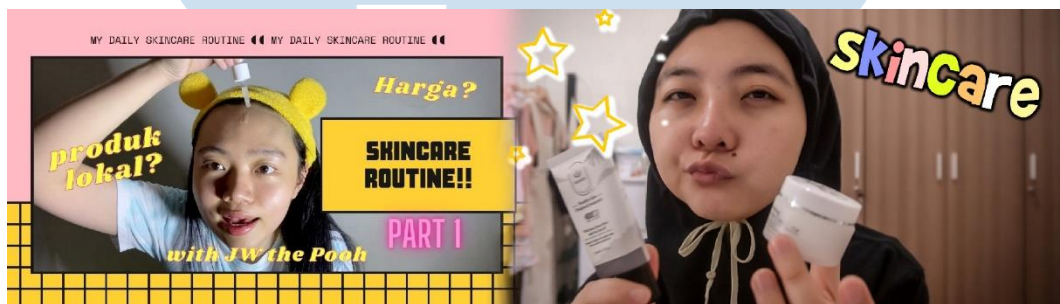
Gambar 3.7. Beauty Creator PT. Merah Kreasi Indonesia

Tahap terakhir yang dilakukan penulis setelah melakukan editing konten adalah Final Delivery . Penulis mengirimkan konten berdurasi 15-20 menit yang telah di render kepada creator terkait melalui google drive agar dapat diunggah ke platform Youtube dengan kualitas yang maksimal. Selain bertanggung jawab pada tahap post-production , penulis juga diminta untuk membuat thumbnail yang akan dipasang pada halaman depan konten tersebut. Thumbnail adalah salah satu hal yang penting agar dapat memancing penonton untuk menonton konten tersebut. Seperti contoh gambar 3.6, penulis bermain dengan teks judul yang berukuran besar dan mencantumkan wajah Geraldy dan Dwiki dalam thumbnail tersebut untuk memperlihatkan wajah mereka yang kebingungan dengan kasus berita yang aneh. Seluruh tahap yang dilakukan penulis juga berlaku untuk seluruh 9 content creator yang menjadi tanggung jawab penulis selama praktik kerja magang.