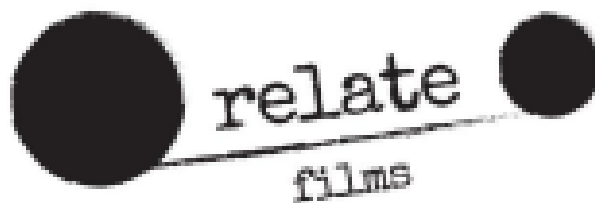
Gambar 2.1 Logo Relate Films