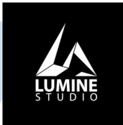
Gambar 2.3 Logo Lumine Studio

Berbagai proyek telah diciptakan dengan kualitas yang luar biasa. Salah satunya adalah Satria Dewa Gatotkaca dari Satria Dewa Studio, sebuah studio yang berasal dari Indonesia, yang diproduksi oleh Lumine sendiri. Selain itu, terdapat The Unlucky Hamster , sebuah animasi 3D yang dikerjakan bersama dengan Studio Qatar yang berasal dari Arab. Film ini berhasil meraih penghargaan pada tahun 2019.