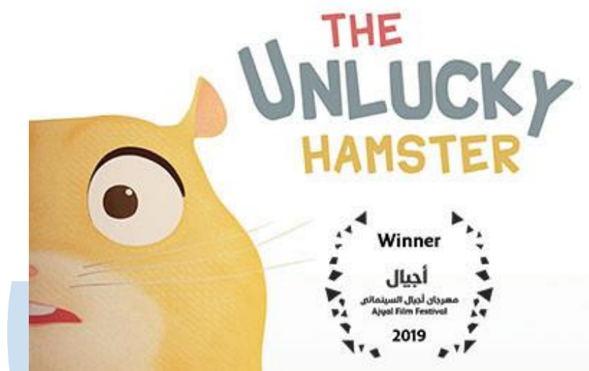
Gambar 2.2 The Unlucky Hamster

Berbagai proyek telah diciptakan dengan kualitas yang luar biasa. Salah satunya adalah Satria Dewa Gatotkaca dari Satria Dewa Studio, sebuah studio yang berasal dari Indonesia, yang diproduksi oleh Lumine sendiri. Selain itu, terdapat The Unlucky Hamster , sebuah animasi 3D yang dikerjakan bersama dengan Studio Qatar yang berasal dari Arab. Film ini berhasil meraih penghargaan pada tahun 2019.