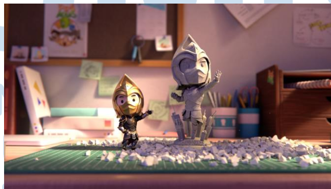
Gambar 2.1 Satria Dewa Gatotkaca

Selama Lumine Studio berjalan, mereka memiliki visi dan misi yang dijadikan sebagai motivasi dan terus maju dalam bekerja. Visi mereka yaitu mampu menyediakan jasa kreatif dari pre-production hingga post-production . Jasa kreatif yang disediakan berpusat pada 3D, seperti permainan 3D, animasi, hingga film live action yang membutuhkan VFX . Karya yang dihasilkan juga harus memiliki kualitas yang profesional sehingga dapat melengkapi apa yang dibutuhkan oleh para klien serta menjadi inspirasi kepada para penikmat. Lumine Studio memiliki misi untuk memusatkan dirinya sebagai studio outsorce yang bersedia untuk melakukan kolaborasi ataupun co-production pada sebuah proyek. Selain itu, Lumine Studio juga membantu dalam pengembangan konten beserta dengan penciptaan intellectual property (IP) orisinal dari local market sampai international market .