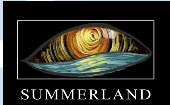
Gambar 2.1 Logo Summerland Film