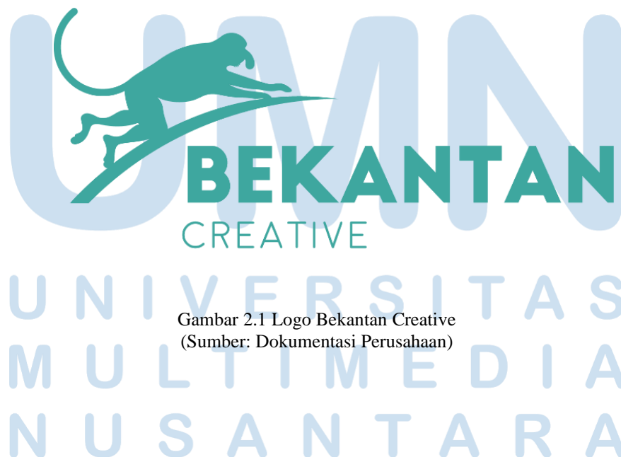
Gambar 2.1 Logo Bekantan Creative

Perusahaan ini didirikan atas keresahan mereka terhadap brand-brand yang memiliki kesulitan untuk menyampaikan ceritanya ke publik secara baik dan optimal. Selain itu, Bekantan Creative juga melihat besarnya potensi pekerja kreatif muda yang memiliki kesulitan untuk mencari pekerjaan di dunia kreatif. Bekantan Creative sendiri hadir untuk berkolaborasi dan berevolusi bersama klien, sesuai dengan motto yang dianut, yaitu " Evolving Creativity ". Nilai-nilai yang dimiliki oleh perusahaan Bekantan Creative adalah berani, unik, humanistik, dan inovatif.