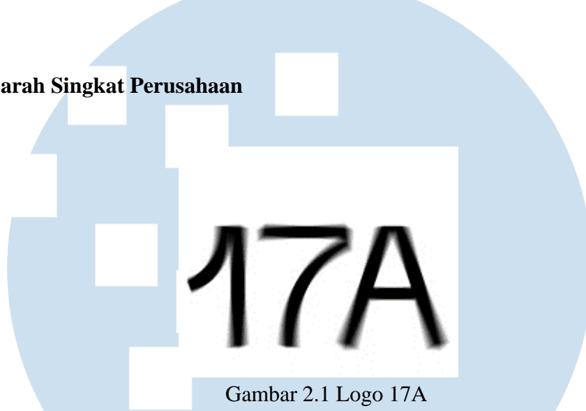
Gambar 2.1 Logo 17A (Dokumentasi Perusahaan, 2021)

Awalnya studio yang bernama Dekraft didirikan oleh Yodhi Prasetyo dan Takun Arrosid pada 2012, berawal dari ketertarikan mereka dengan dunia sinematografi dan gaya kontemporer yang kemudian dijadikan sebagai karir. Proyek yang Dekraft kerjakan merupakan video pernikahan, namun terdapat beberapa proyek yang dapat dibilang sebagai dokumentasi dan digital video . Pada Agustus 2019, Dekraft mengganti nama mereka menjadi Studio 17A dengan Takun Arrosid sebagai pendiri dan sampai saat ini telah menghasilkan berbagai macam karya seperti musik video, iklan, video pernikahan, dan dokumentasi. Studio tersebut berlokasi di Petimuran, Cipete, Jakarta Selatan.