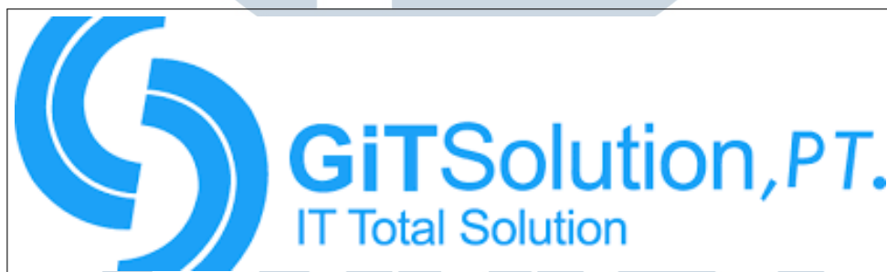
Gambar 2.1. Logo PT. GIT Solution

PT. GIT Solution adalah salah satu badan usaha milik Yayasan Universitas Amikom Yogyakarta yang bergerak pada jasa perencanaan pembangunan dan pengembangan sistem informasi. PT. GIT Solution sudah berdiri sejak tahun 2003. Perusahaan ini memiliki beberapa divisi diantaranya yaitu software development , game development , creative multimedia , IT training , dan digital marketing . Perusahaan ini menyediakan beberapa layanan dan jasa seperti pembuatan suatu aplikasi berbasis web , desktop , mobile , game 2D/3D , AR , VR 360 . Selain itu menyediakan layanan dan jasa untuk pembuatan design , animasi, cinema videography yang ditujukan untuk kebutuhan periklanan dan branding suatu perusahaan (Dokumen Internal Perusahaan).