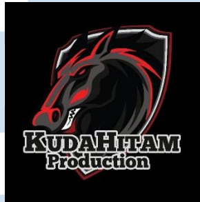
Gambar 2.1 Logo Kuda Hitam Production

Kuda Hitam Production merupakan Production House yang berlokasi di jalan Medokan Asri Barat, Gunung Kidul, Kecamatan Rungkut, Kota Surabaya. Production House ini merupakan anak perusahaan dari PWO Films yang ada di Surabaya. PWO Film ini merupakan singkatan dari Pravana Widho Oktendo, dimana singkatan dari nama pendiri perusahaan tersebut. Film yang dihasilkan berupa film dokumenter dan film fiksi. Kuda Hitam Production adalah satu-satunya anak perusahaan bagi orang yang menjadi penggiat film untuk berlatih, contohnya anak magang dan pekerja baru.