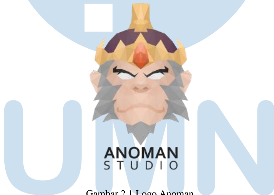
Gambar 2.1 Logo Anoman

Anoman studio adalah studio yang bergerak dibidang game development terutama di platform mobile dan Desktop . Studio ini berdiri pada tahun 2014 dan berada di Jakarta. Studio Anoman telah memenangkan beberapa penghargaan diantaranya adalah merit award dari INAICTA pada tahun 2015, Top 100 Best Indie Games dari INDIEDB pada tahun 2015 dan PC& Console Game of The Year pada tahun 2017. Tidak hanya games , studio Anoman juga bergerak dibidang animasi yang salah satunya dimasukkan ke platform Youtube .