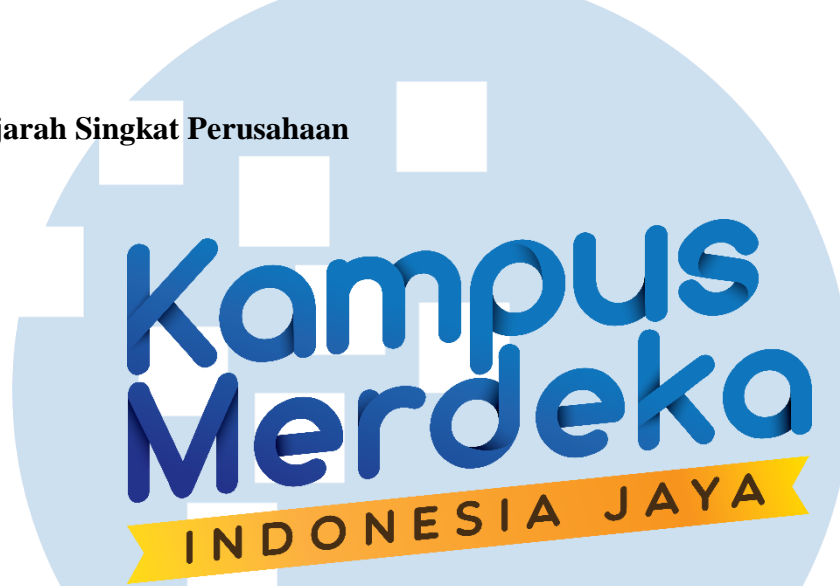
Gambar 2.1 Logo Kampus Merdeka

Pada bulan Februari tahun 2020 Menteri Pendidikan dan Kebudayaan mengeluarkan Permendikbud no. 3 tahun 2020 tentang Standar Nasional Pendidikan. Salah satu hal penting dari lahirnya Permendikbud tersebut adalah lahirnya Program Kampus Merdeka, dengan Merdeka Belajar Kampus Merdeka salah satu sebagai inisiatif utama yang akan diimplementasikan. Program Kompetisi Kampus Merdeka adalah program hibah bergengsi yang diinisiasi oleh Kemendikbudristek dan diluncurkan tahun 2021.