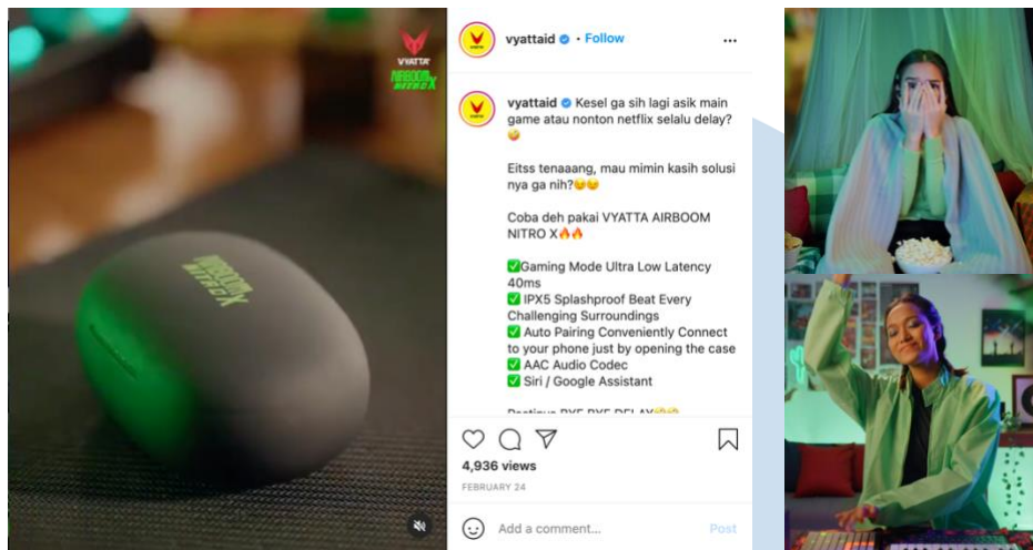
Gambar 2.3 Still Image dan Instagram Post “Vyatta ID – Airboom NitroX”