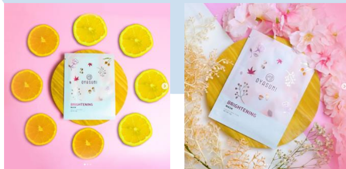
Gambar 2.1 Still Image “ Oyasumi Mask ”

Alma Films merupakan sebuah production house yang berdiri pada tahun 2020. Alma Films berlokasi di Tangerang Selatan dan Bekasi. Alma Films selalu ingin membuat mimpi klien menjadi kenyataan serta membawa klien untuk menjadi lebih dekat dengan tujuan realisasi audio visual . Alma Films bergerak memproduksi digital ads, music video, company profile dan berbagai bentuk produk media audio visual lainnya. Alma films sejauh ini telah memproduksi beberapa iklan komersial antara lain: “ Oyasumi Mask ”, “ Living Works ”, “ Vyatta - Airboom NitroX ”, dan “ Erha - True White ”.