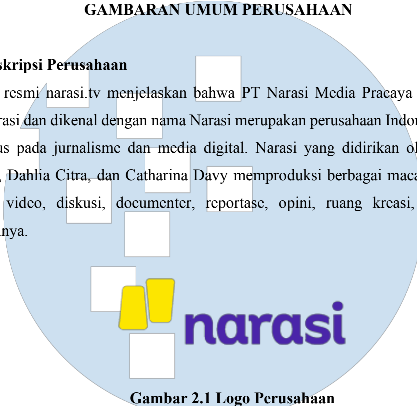
Gambar 2.1 Logo Perusahaan

Laman resmi narasi.tv menjelaskan bahwa PT Narasi Media Pracaya atau yang beroperasi dan dikenal dengan nama Narasi merupakan perusahaan Indonesia yang berfokus pada jurnalisme dan media digital. Narasi yang didirikan oleh Najwa Shihab, Dahlia Citra, dan Catharina Davy memproduksi berbagai macam konten seperti video, diskusi, documenter, reportase, opini, ruang kreasi, dan lain sebagainya.