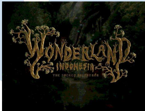
Gambar 1. 2 Potret Wonderland Indonesia 2: The Sacred Nusantara

yang menceritakan bahwa Indonesia sebagai negeri ajaib dengan kekayaan melimpah dengan berbagai macam mulai dari lagu, pakaian, alat musik, pakaian, dan rumah adat di berbagai provinsi di Indonesia. Proyek ini menggabungkan musik dan budaya tradisional yang dikonsep secara modern menjadi bukti bahwa pemuda Indonesia mampu membawa Indonesia ke level dunia. Pada Agustus 2022, Alffy Rev kembali mengeluarkan karya kedua, yaitu Wonderland Indonesia 2: The Sacred Nusantara dengan respon positif jumlah penonton lebih dari 10 juta pada kurun waktu 2 bulan dengan jumlah like lebih dari 1 juta pengguna Youtube dan sempat menjadi trending Youtube.