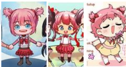
Gambar 3.3. Contoh depiksi tokoh Reon dalam gaya gambar Chibi

Menurut Shin Abe, inti dari perubahan tokoh dari proporsi "dewasa" menjadi "anak-anak/cebol" adalah untuk menambahkan unsur komedi atau parodi, untuk membuat gambar menjadi lebih "imut" dan lebih menarik.