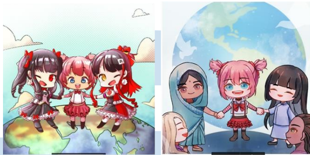
Gambar 3.2 Referensi ilustrasi Hari Perdamaian Internasional tahun 2019 (kiri) dan 2020 (kanan) (dokumen pribadi, 2021)

Dari gambar-gambar referensi di atas, penulis menyimpulkan bahwa gaya gambar yang dimina merupakan gaya gambar Super Deformed , dilihat dari proporsi tokoh yang lebih ciut (tinggi badan kira-kira 2,5 kali tinggi kepala) dan juga detil-detil tokoh yang lebih simpel, terutama bisa dilihat dari detil pada kaki dan tangan pada gambar di sebelah kiri.