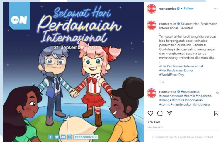
Gambar 3.7. Post Hari Perdamaian Internasional

Setelah semua aset selesai dibuat oleh penulis, penulis mengirim file PSD berisi aset-aset tersebut kepada supervisor , yang akan menambahkan judul dan banner re:ON dan melakukan perubahan-perubahan akhir yang perlu dilakukan. Setelah tambahan-tambahan tersebut selesai, hasil jadi post tersebut di- post ke akun Instagram resmi re:ON Comics (@reoncomics).