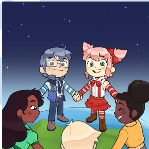
Gambar 3.6. Hasil akhir ilustrasi Hari Perdamaian Internasional (dokumen pribadi, 2021)

Setelah menerima brief singkat melalui pesan WhatsApp, penulis mulai bekerja dalam program Clip Studio Paint, dimulai dari sketsa, lalu lineart dan kemudian warna. Semua aset diletakkan dalam layer yang terpisah satu sama lain, agar supervisor bisa mengedit letak aset dengan mudah. File akhir yang dikirim ke supervisor dalam bentuk PSD.