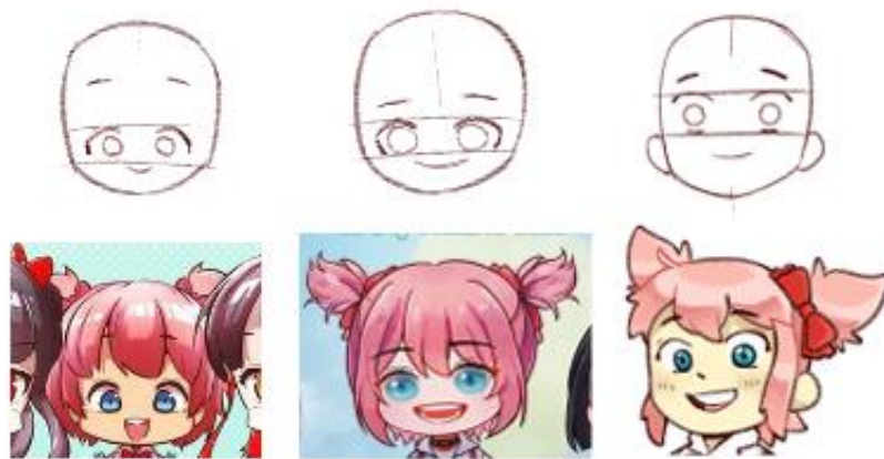
Gambar 3.5. Perbandingan proporsi wajah ilustrasi tahun 2019 (kiri), 2020 (tengah) dan 2021 (kanan)

Untuk memenuhi syarat gaya gambar "chibi", penulis menggambarkan tokoh dengan proporsi yang terlihat di gambar, yaitu dengan tinggi tubuh total kira-kira 2.5x tinggi kepala. Dibandingkan dengan contoh ilustrasi Hari Perdamaian Internasional tahun-tahun sebelumnya, penulis tidak terlalu meng- exaggerate ukuran besar kepala, dengan pundak kira-kira selebar kepala. Pada tahun-tahun sebelumnya, lebar pundak tokoh dibuat jauh lebih kecil dibanding lebar kepala. Penulis juga memilih untuk menjaga bentuk simpel kaki tetap terlihat, tidak seperti contoh tahun 2019, untuk membantu kesan perspektif pada gambar.