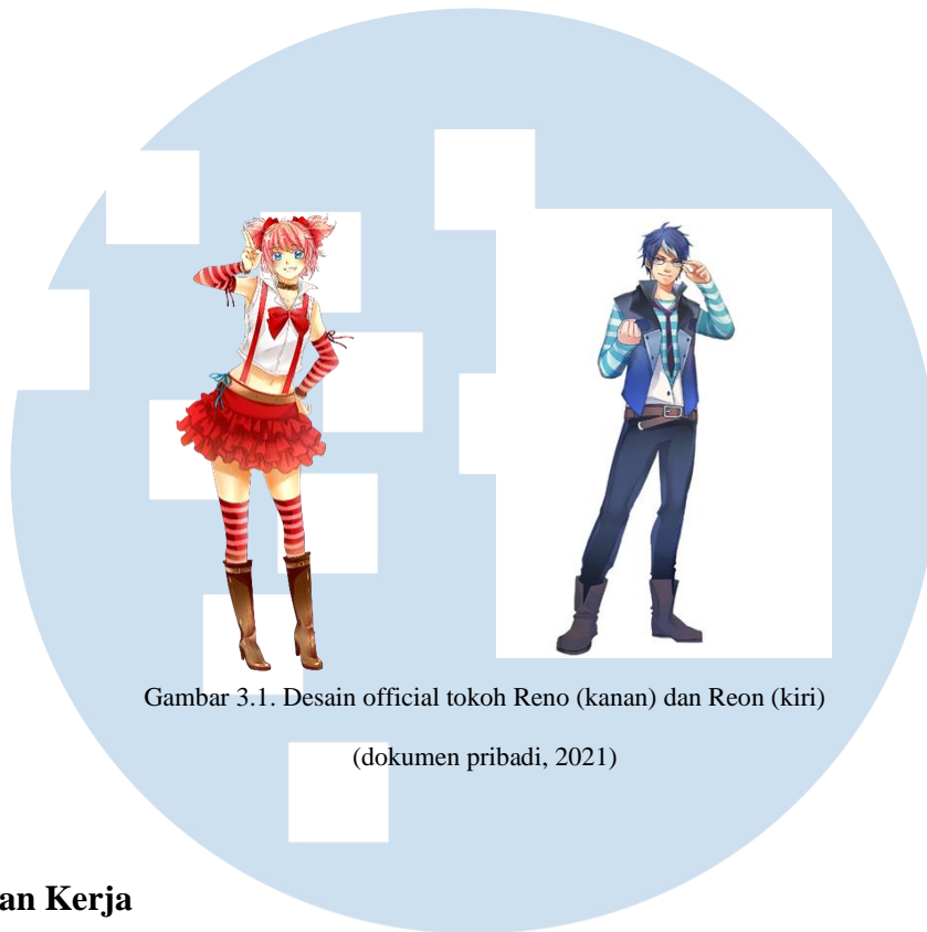
Gambar 3.1. Desain official tokoh Reno (kanan) dan Reon (kiri)