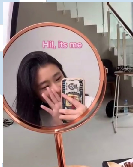
Gambar 2.4 Dokumentasi Perkenalan Penulis

Penulis lebih sering berdiskusi dengan Maria untuk menentukan moodboard bersama agar sesuatu yang divisualisasikan sesuai keinginan dan cerminan dari brand . Penulis membuat konsep dan ide kreatif dalam pembuatan video. Penulis juga bertanggung jawab atas kenaikan viewers dari video yang sudah di upload