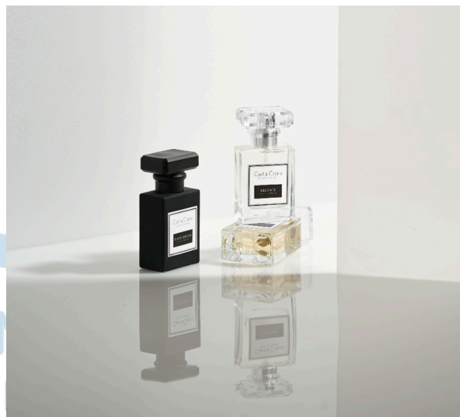
Gambar 2.2 Parfum Carl and Claire

Parfum dengan harga yang murah atau dapat dikatakan terjangkau, memiliki kualitas yang kurang baik. Nouva menghadirkan brand parfum Carl and Claire sebagai solusi untuk khalayak orang yang memiliki keuangan yang terbatas tetapi mendapatkan produk dengan kualitas yang baik. Brand Carl and Claire membutuhkan digital content yang mencakup content creator untuk mengembangkan brand secara digital . Adanya creator yang memberikan ide-ide dan konsep secara kreatif membuat brand Carl and Claire lebih dikenal oleh khalayak umum. Pembuatan video yang dilakukan oleh creator menambahkan aset kreatif perusahaan dalam memproduksi digital content .