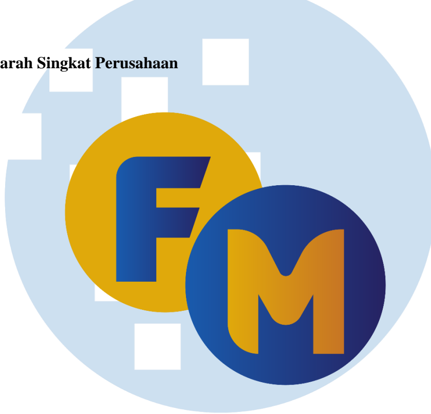
Gambar 2.1. Logo Freakout Media ( Instagram.com/freakoutmedia.id )

Freakout Media didirikan oleh Novita Chrisyanti atau yang lebih akrab di kenal dengan Smir, dan mulai beroperasi pada tahun 2019 sebagai media yang khusus membahas fashion . Kemudian pada awal tahun 2021, Freakout Media melakukan transisi dari media yang membahas fashion menjadi media yang membahas lifestyle dan menyajikan news dengan gaya kekinian dan interaktif.. Freakout Media memiliki visi untuk menjadi media hiburan yang memberikan pengetahuan yang luas dan informasi yang dikemas secara menarik. Untuk mewujudkan visi tersebut, Freakout Media membuat berbagai macam konten menarik yang berisikan tentang pengetahuan dan berita yang dapat dipercaya kebenarannya.