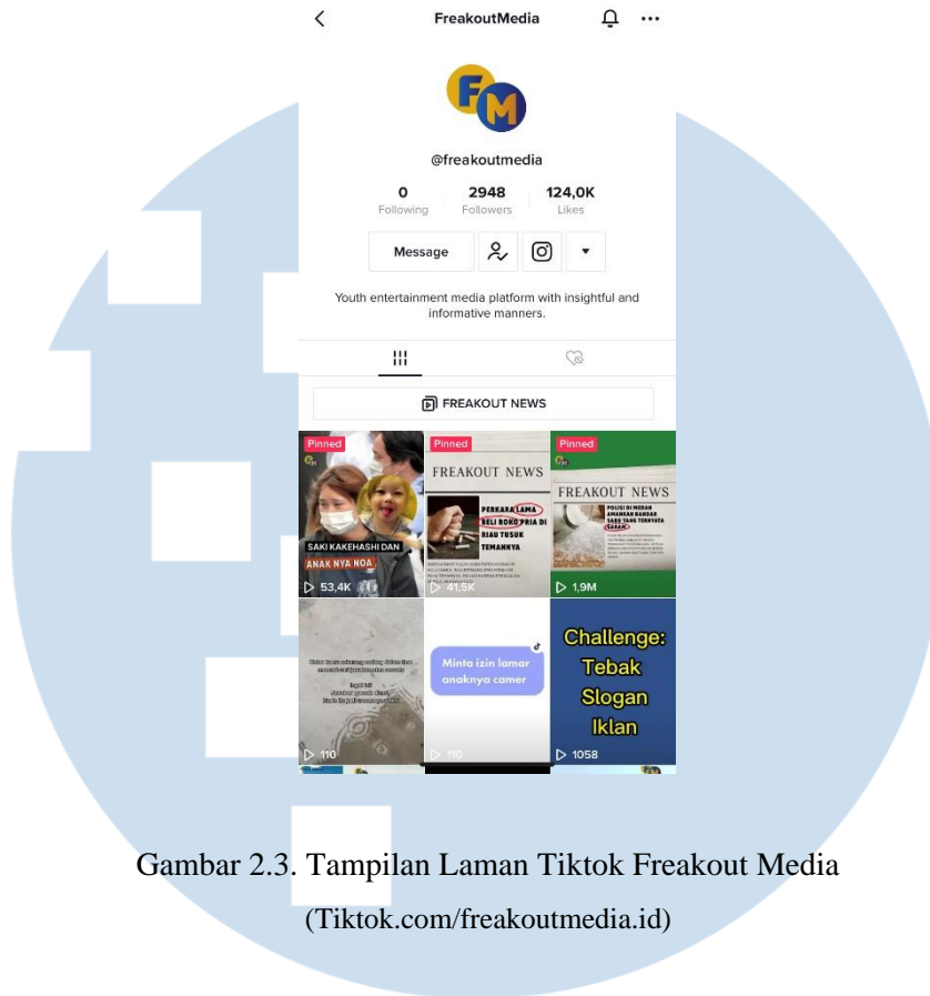
Gambar 2.3. Tampilan Laman Tiktok Freakout Media ( Tiktok.com/freakoutmedia.id )

Melihat antusiasme pengguna media sosial terhadap konten Freakout Media, Freakout Media melebarkan sayapnya ke Tiktok untuk meraih lebih banyak pengguna media sosial. Awal tahun 2022, Freakout Media resmi meluncurkan konten Freakout News pertama di Tiktok dengan format video 9:16. Video pertama Freakout News di Tiktok telah meraih 1,9 juta penonton.