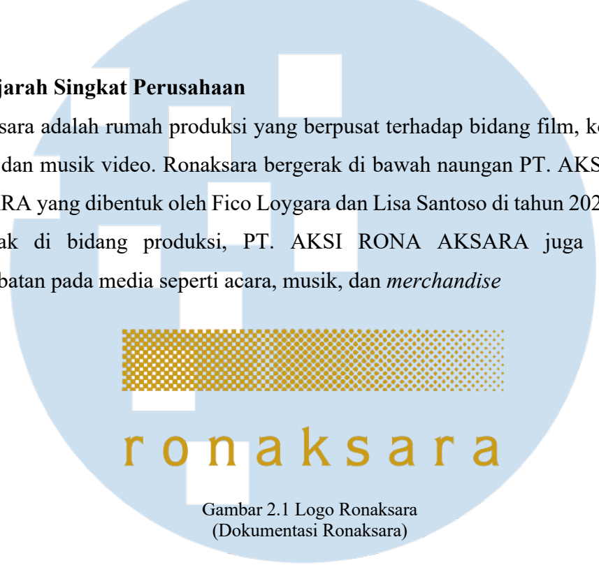
Gambar 2.1 Logo Ronaksara