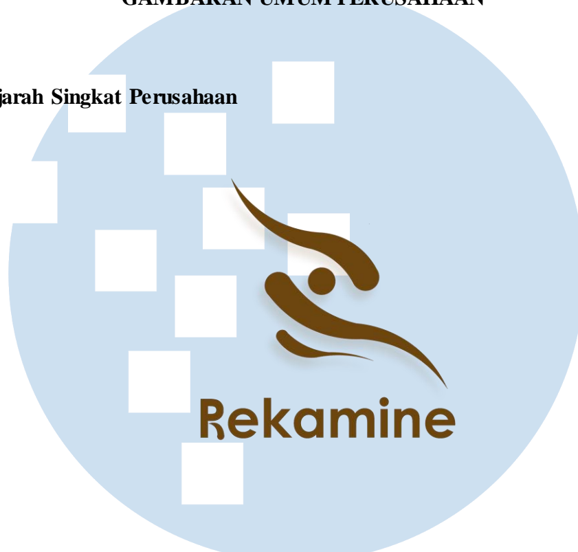
Gambar 2.1 Logo perusahaan Rekamine Film

Rekamine Film merupakan rumah produksi yang menyediakan jasa produksi iklan berbasis video untuk sosial media. Rekamine Film didirikan pada tahun 2020, dan fokus pada sosial mediana yaitu Instagram . Rekamine Film sendiri dikenal sebagai production house yang bergerak menyediakan layanan jasa produksi video iklan dengan harga yang terjangkau, namun tetap menghasilkan karya-karya dengan kualitas yang baik.