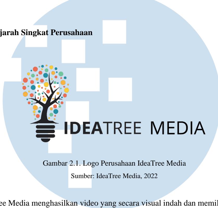
Gambar 2.1. Logo Perusahaan IdeaTree Media