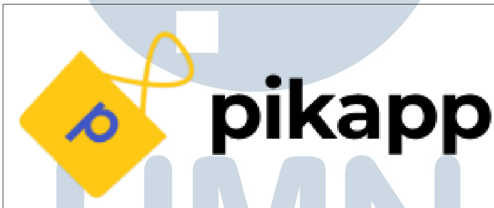
Gambar 2.1. Pikapp Indonesia