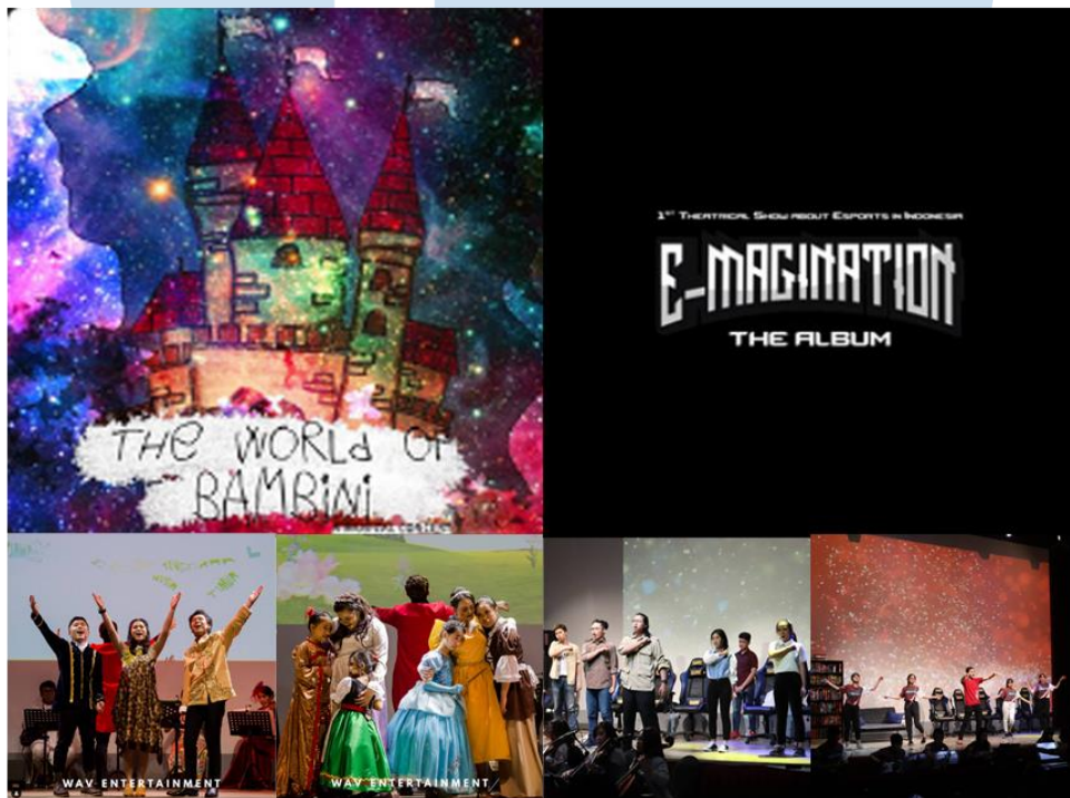
Gambar 2.2 Portofolio WAV Entertainment