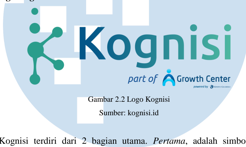
Gambar 2.2 Logo Kognisi