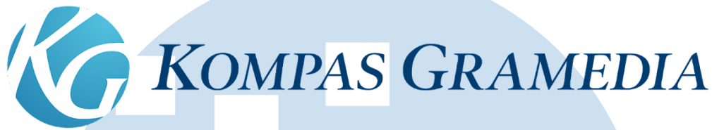
Gambar 2.1 Logo Kompas Gramedia