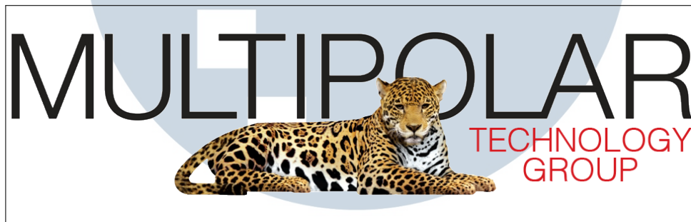
Gambar 2.1. Logo Perusahaan PT Multipolar Technology

Perusahaan Multipolar Technology merupakan anak dari perusahaan Multipolar Group yang didirikan pada tahun 1975. Perusahaan ini bergerak dibidang teknologi dengan menyediakan layanan teknologi terkini, mulai dari infrastruktur, dan solusi TI dengan standar sertifikasi ISO 9001 yang komprehensif sehingga dapat mendorong keunggulan kompetitif pelanggan[2]. Logo dari perusahaan Multipolar Technology dapat dilihat dari gambar berikut.