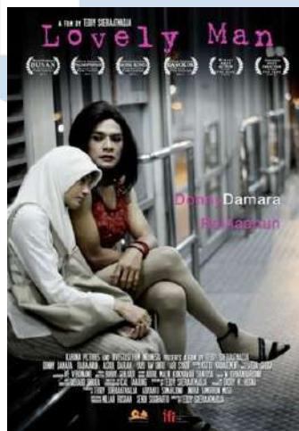
Gambar 2.1 Poster Film Lovely Man