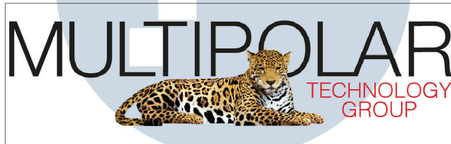
Gambar 2.1. Logo Perusahaan Multipolar

Perusahaan PT Multipolar Technology Tbk merupakan anak perusahaan dari PT Multipolar group yang berdiri sejak 1975. PT Multipolar Technology merupakan perusahaan yang bergerak di bidang teknologi dan digital. PT Multipolar Technology menyediakan berbagai layanan teknologi yaitu salah satunya IT Consultant dengan standar sertifikasi ISO 9001.